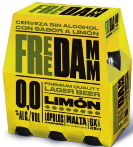
25 cl SIN RETORNO (Pack 6 u.)