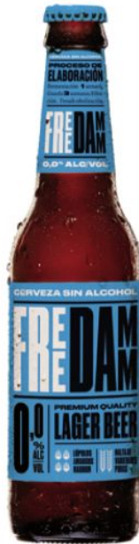
33 cl RETURNABLE 20 cl RETURNABLE