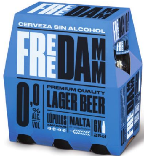
25 cl SIN RETORNO (Pack 6 u.)