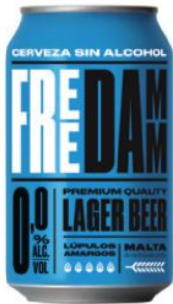
Lata 33 cl Lata 33 cl (retractil 12 u.)