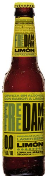
33 cl RETURNABLE 20 cl RETURNABLE