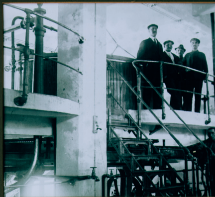
OPERARIOS EN LA FÁBRICA DE EL ANTIGUO LANGILEAK ANTIGUAKO FABRIKAN