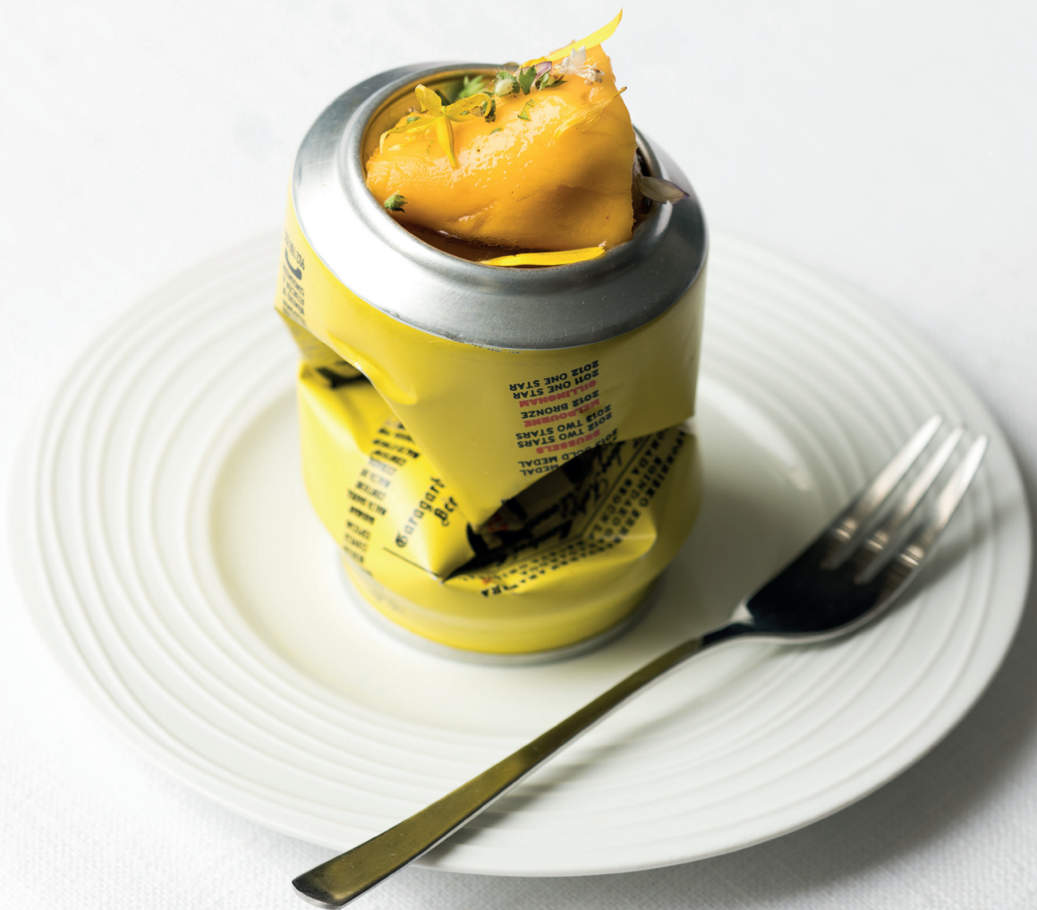
TXISTORRA CON KELER Y MANGO, DE ARZAK TXISTORRA, KELER ETA MANGOAREKIN, ARZAKEKOA